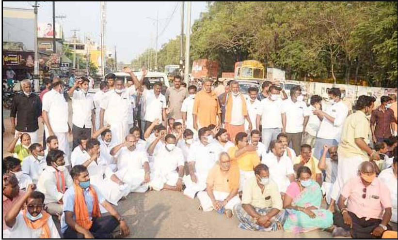
போராட்டத்தில் ஈடுபட்ட இந்து அமைப்பினர்...