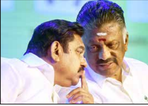
இபிஎஸ் - ஓபிஎஸ்