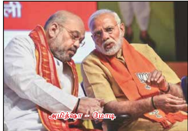
அமிதஷா = மோடி

இதுவரை உத்தரப்பிரதேச தேர்தலுக்கான வந்துள்ள கருத்துக்கணிப்புகளில் காங்கிரஸ் கட்சி மிக மோசமான நிலையில் இருப்பதையே உணர்த்தியுள்ளன. இரண்டு இலக்கங்களில் வெற்றி பெறுவதே சிரமம் என்றும் இந்த கருத்துக் கணிப்பில் தெரியவந்துள்ளது. அதிகபட்சமாக காங்கிரஸ் கட்சிக்கு ஏழு தொகுதிகளில் வெற்றி கிடைக்கலாம் என்று தெரியவந்துள்ளது. இந்தநிலையில், உத்தரப்பிரதேசத் தேர்தலுக்கான இந்தியா டிவி கருத்துக் கணிப்பு வெளியாகி இருக்கிறது. இந்தத் தேர்தலில் பாஜக வெற்றி பெற்று இரண்டாவது முறையாக ஆட்சி அமைக்கும் என்று தெரிவித்துள்ளது. உத்தரப்பிரதேசத்தில் மொத்தம் உள்ள 403 தொகுதிகளில் 230 முதல் 235 தொகுதிகளைக் கைப்பற்றும் என்று கருத்துக்கணிப்பு தெரிவித்திருக்கிறது.