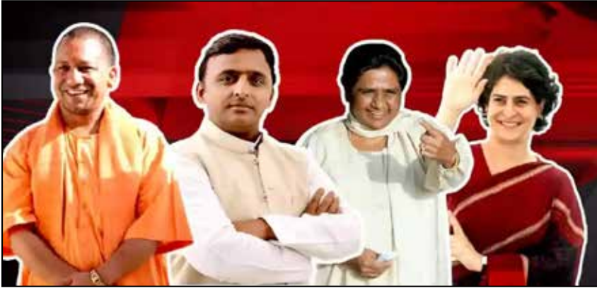
யோகி ஆதித்யநாத் - அகிலேஷ் - மாயாவதி - பிரியங்கா

வாக்கு சதவீதத்தைப் பொறுத்தவரையில் பாஜகவுக்கு 39.9%; காங்கிரஸுக்கு 37.5%; ஆம் ஆத்மி கட்சிக்கு 13.1% வாக்குகள் கிடைக்கும். இவ்வாறு கருத்து கணிப்பில் தெரிவிக்கப்பட்டுள்ளது. உத்தரகாண்ட் மாநிலத்தில் மொத்தம் 70 தொகுதிகள் உள்ளன. அனைத்து இடங்களுக்கும் ஒரே கட்டமாக